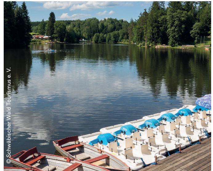
Ebensee, Perle im Schwäbischen Wald